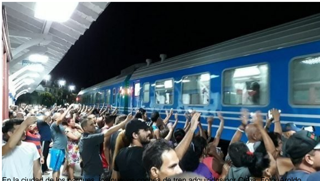
En la ciudad de los parques, los nuevos coches de tren adquiridos por Cuba.

A partir del próximo 13 de julio una noticia muy esperada por miles de cubanos se hará realidad: Iniciará el servicio de transportación ferroviaria con los coches chinos adquiridos recientemente en el país. Para conocer en detalles cuáles serán los precios, los itinerarios y otros elementos imprescindible de cara al nuevo servicio, la Mesa Redonda dialogó con el ministro del ramo y otros directivos de la Unión de Ferrocarriles de Cuba.