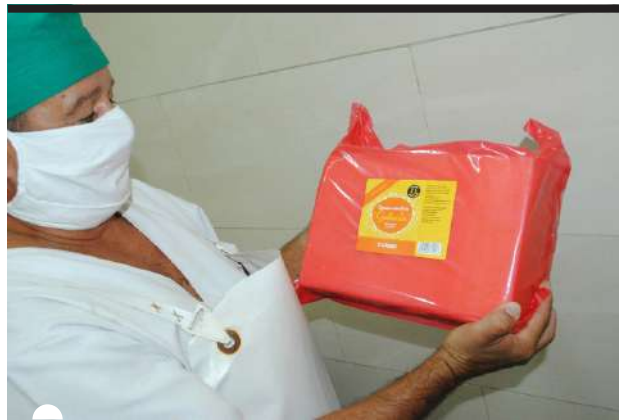
LOS COSTOS encarecen notablemente la producción de quesos

de soya, una en Guanajay y otra en Bahía Honda, donde se convierte el grano en leche vegetal, un alimento de alta demanda mundial aunque no existan hábitos de consumo en Cuba.