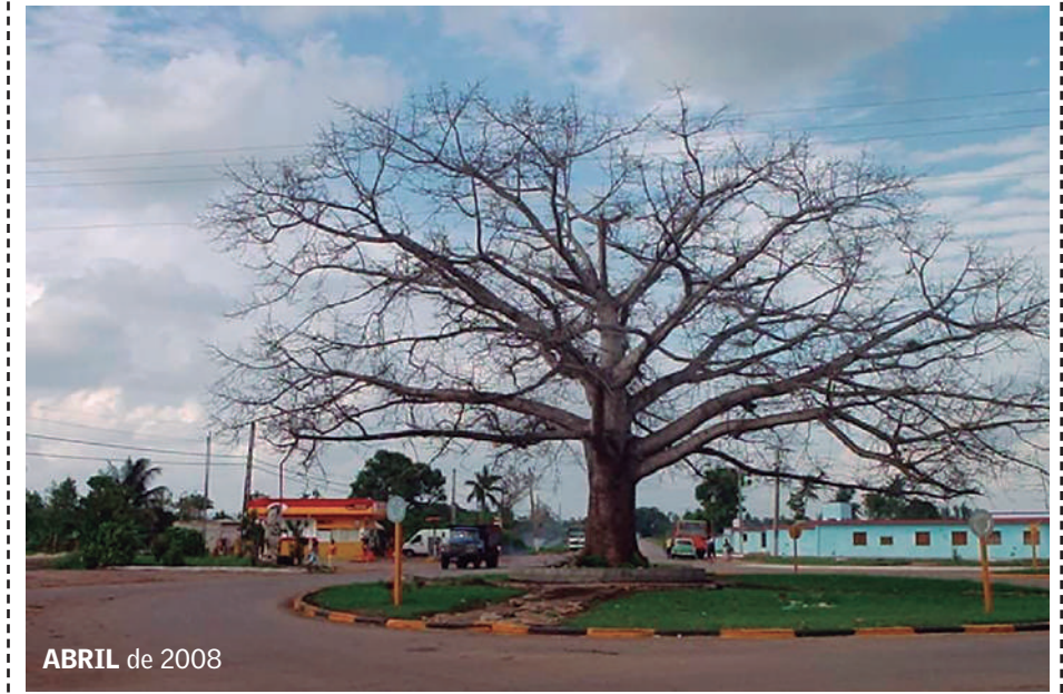
ABRIL de 2008