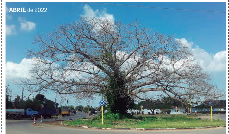
ABRIL de 2022