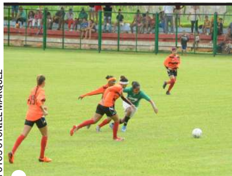
EL ONCE de casa sigue en la pelea

“Pero Villa Clara juega muy bien con el balón. Es el campeón vigente del certamen —advierde Carrera. Equivocamos nuestro juego: llevamos más el balón, en lugar de tenerlo y tocar, y no salieron las cosas. De todas maneras, nos mantenemos terceros. Quedan tres partidos: de ganarle a Las Tunas y Cienfuegos, clasificaremos sin problemas”.