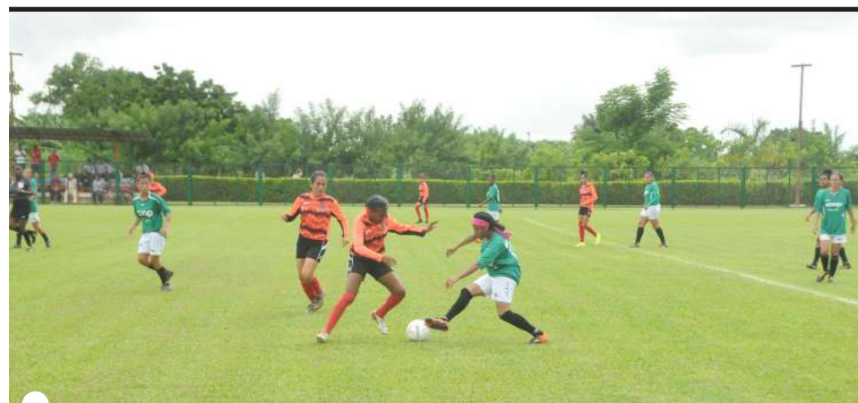
LA MAGIA del centro del campo ha de servir más balones para convertir en goles

Artemisa retiene el tercer puesto, con seis unidades. Le siguen Cienfuegos (solo una victoria y tres puntos) y Las Tunas (cuatro derrotas, 26 goles en contra y ninguno a favor). Al finalizar esta etapa, clasificarán las tres primeras de cada grupo a una semifinal de seis para determinar las finalistas del torneo.